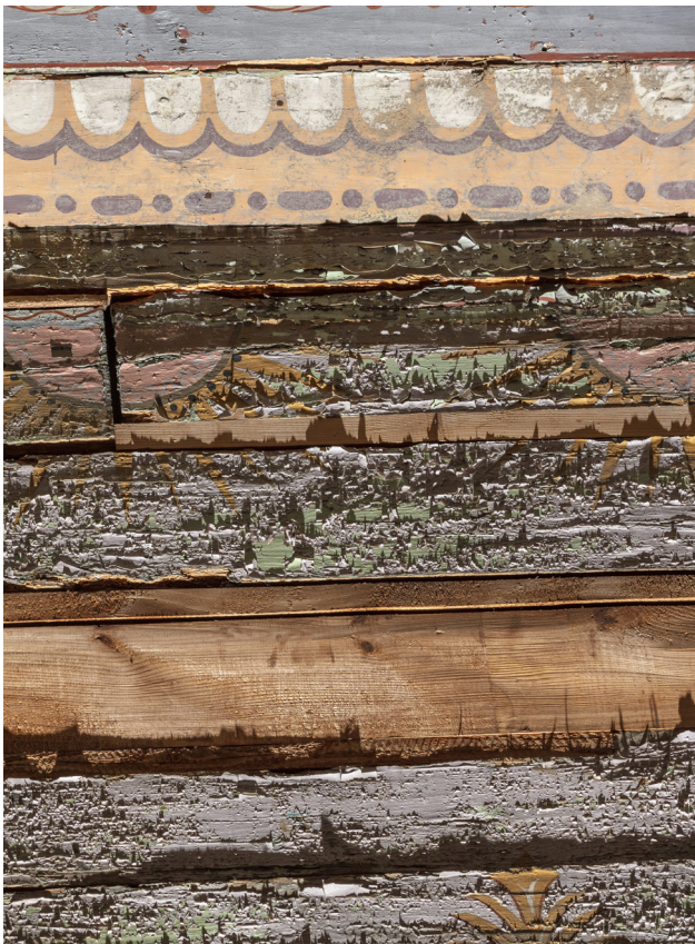
Zdjęcie w świetle bocznym ukazujące uniesione łuski farby, jej ubytki oraz pęknięcia drewna. Widoczne fleki pozbawione warstw malarskich.