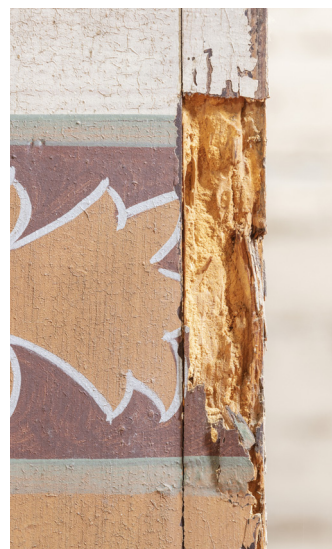
Drewno ścian zaatakowane przez drewnojady.