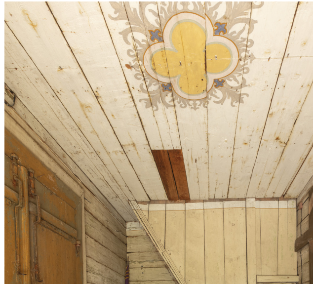
Fragment sufitu kruchty, stan zachowania drewna i polichromii.