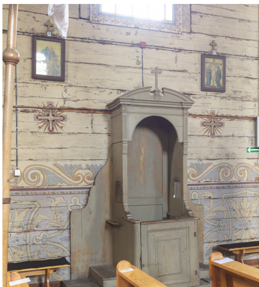
Bardzo zły stan zachowania warstw farby na ścianach kościoła

Stan zachowania drewna ścian jest bardzo zły drewno jest zaatakowane przez drewnojady oraz mikroorganizmy. Struktura drewna jest mocno osłabiona, w wielu miejscach drewno jest spękań i powyłamywane. Widoczne jest wiele fleków drewnianych pozbawionych warstw polichromii. Konieczne są pilne prace konserwatorskie zarówno wobec drewnianego podłoża jak i warstw malarskich.