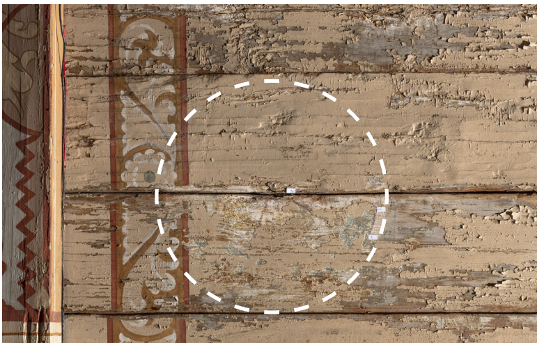
Zarys zacheuszka z najstarszej warstwy polichromii z XVIII w. Odkrywka E na ścianie zachodniej oraz próbki 3,4 i 9.