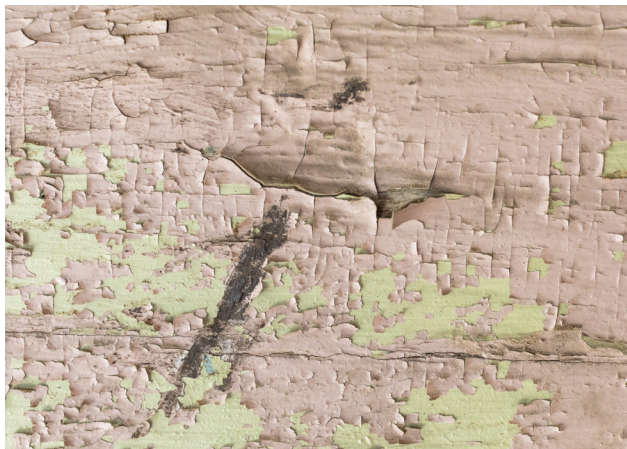
Warstwy olejne z IV chronologii, łuszczą się i odstają miejscowo III chronologii – jasnozielone wymalowanie.