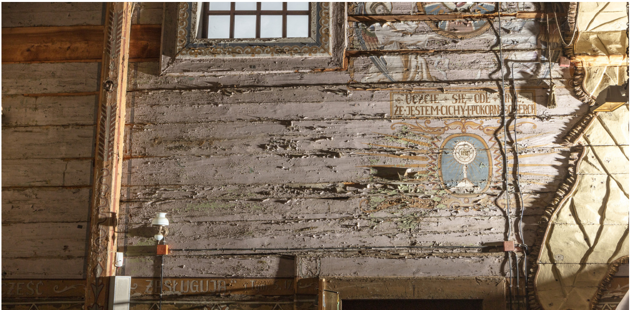
Zdjęcie w świetle bocznym ukazujące uniesione łuski farby, jej ubytki oraz pęknięcia drewna.