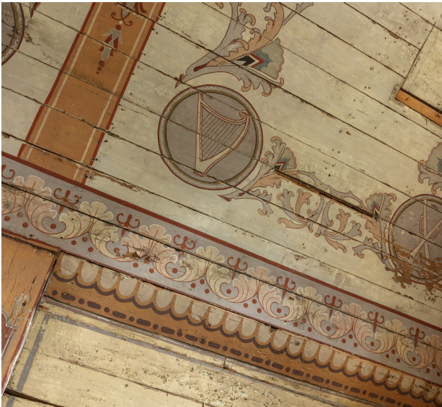
Fragment sklepienia nawy głównej, stan zachowania drewna i polichromii.

Stan zachowania warstw polichromii na sklepieniach jest bardzo zły. Warstwy farby są spękań i w wielu miejscach odspojone od podłoża i wykruszone. Warstwa malarska jest bardzo krucha, a uniesione łuski ulegają łatwo wykruszeniu. Stan zachowania drewna ścian jest bardzo zły, a jego struktura jest mocno osłabiona. W wielu miejscach drewno jest spękań i powyłamywane. Widoczne jest wiele fleków drewnianych pozbawionych warstw polichromii.