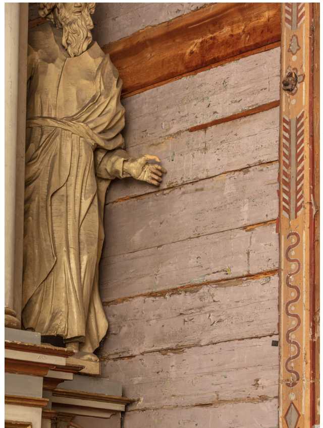
Fragment ściany w prezbiterium z widocznymi spękaniem i ubytkami warstw polichromii.