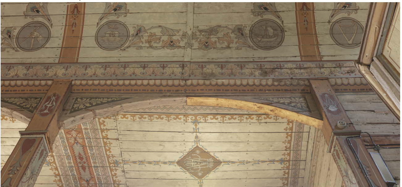
Fragment sklepienia nawy głównej oraz sufit nad nawą boczną, stan zachowania drewna i polichromii.