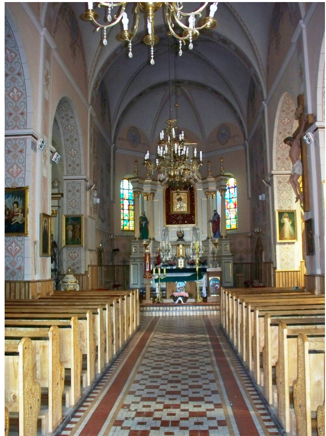
Stanisław Długozima, polichromia kościoła w Waniewie, 1972

Strop naw bocznych: dekoracja ramowa z motywem zygzaka, pęków liści laurowych i szlaczka ze stylizowanych lilii, w polu centralnym romby wypełnione przedstawieniami symboliczno-religijnymi.