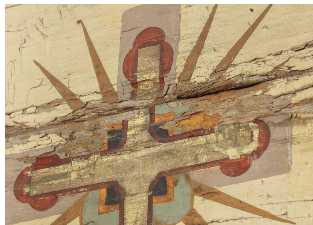
Spękania i ubytki drewna wraz z warstwami malarskimi.