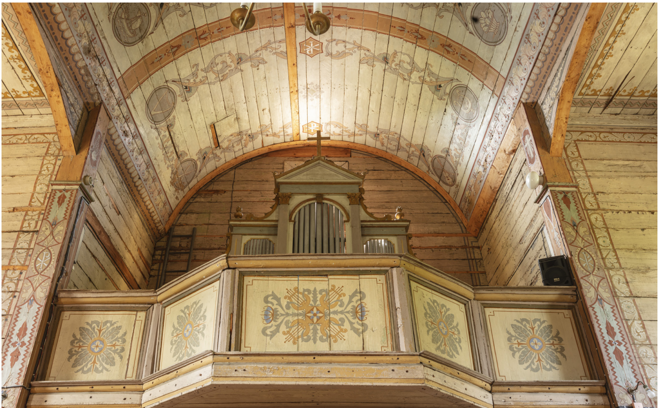
Wnętrze kościoła pw. św. Barbary w Kramarzewie, widok na sklepienie oraz polichromie na emporze.